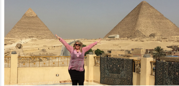
Her bor vi! Right upfront Giza Pyramiderne.

Tilmeldingsfrist: Først-til-mølle princippet / 20. oktober Depositum: Depositum: kr. 5.000 betales ved tilmelding.